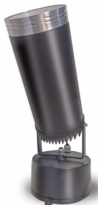
Luminaire: Ledil Oy FCP13895_SEANNA-A_(XHP35_HI)_SIMULATED Lamps: 1 x Cree XHP35 HI